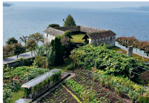
Blick aus einer Zelle auf Klostergarten und Zürichsee.