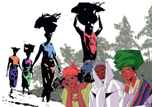
Titelbild 2026 Nigeria Ruhe für die Erschöpften, von Gift Amarachi Ottah

Am 5. März wird in über 150 Ländern der Welt der Weltgebetstag gefeiert. Dieses Jahr haben Frauen aus Nigeria den Gottesdienst für uns vorbereitet. Das Thema «Ich will euch stärken, kommt!» ist eine Einladung an alle, die beladen sind und schwere Lasten zu tragen haben. In einer Feier teilen wir die Sorgen mit den Frauen aus Nigeria, stärken einander und schöpfen neue Kraft aus der Gemeinschaft.