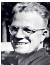
Widerstandskämpfer Alfred Delp.

Delp war Mitglied des Kreisauer Kreises im Widerstand gegen den Nationalsozialismus, was ihn schliesslich sein Leben kostete.