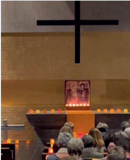
Kerzenlicht zum Taizégebet in Baldegg.